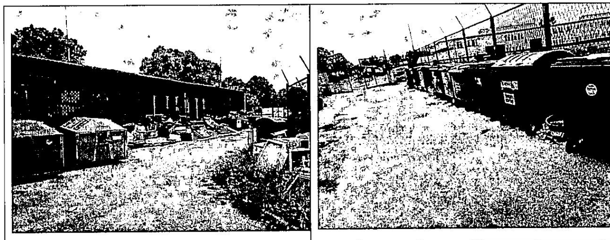
Fot. 2 i 3 widok ogólny placu składowego PSZOK